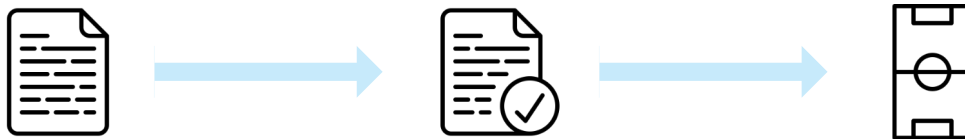
Weg zum Sport

Eine Missachtung der Rahmenbedingungen und der selbst aufgestellten Hygienerichtlinien führt zur unmittelbaren Einstellung des Sportangebots.